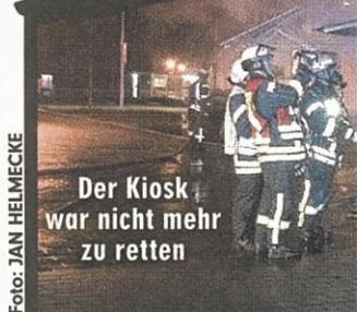
Der Kiosk war nicht mehr zu retten