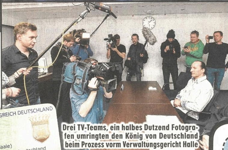
Drei TV-Teams, ein halbes Dutzend Fotografen umringten den König von Deutschland beim Prozess vorm Verwaltungsgericht Halle

Der selbstgebastelte Führerschein des Königreichs