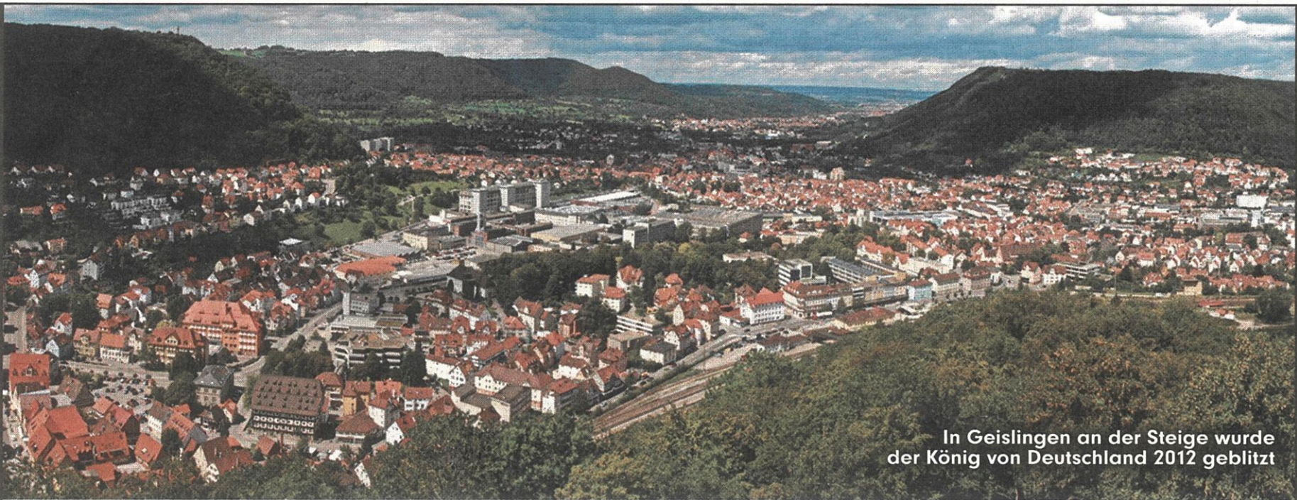
In Geislingen an der Steige wurde der König von Deutschland 2012 geblitzt