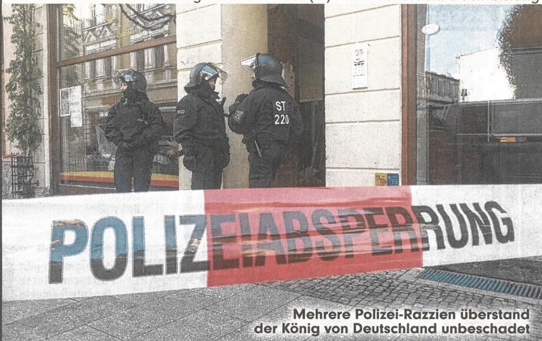
Mehrere Polizei-Razzien überstand der König von Deutschland unbeschadet

Wegen des nicht bezahlten Blitz-Knöllchens gibt es jetzt einen Erziehungshaftebefehl