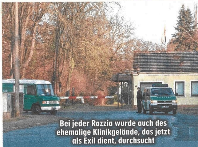
Bei jeder Razzia wurde auch das ehemalige Klinikgelände, das jetzt als Exil dient, durchsucht

„Momentan kommen wir nicht rein. Aber es läuft ein Widerspruchsverfahren“, gibt sich der Ausgesperrte optimistisch. Gestern betrat er sein Exil: die ehemalige Dialyse-Klinik am Rande von Wittenberg.