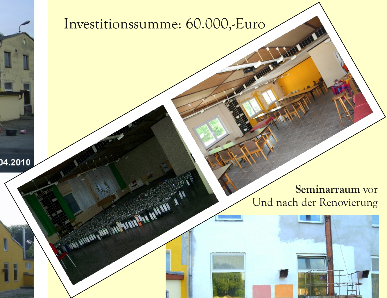
Seminarraum vor Und nach der Renovierung